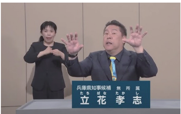
政見放送でウソと憶測を垂れ流し、民意を歪めた

ウソと憶測と名誉毀損で固められたこの演説がSNSで拡散され、多くの県民が騙されて洗脳されてしまった。事実①斎藤候補は100条委員会でもパワハラ行為を認めている。②テレビや新聞は100条委員会とその後記者会見を客観報道しただけ。そもそも、もしテレビがウソをついていたなら、その時点で斎藤候補側が抗議